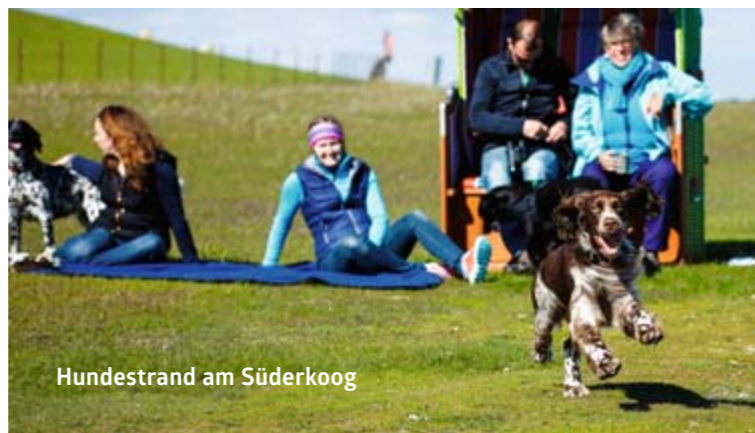
Hundestrand am Süderkoog

Detaillierte Informationen zu Quartieren und Gastronomie finden sie im Gastgebermagazin oder lassen Sie sich in der Tourist-Information beraten: Tel. 04844-189 40.