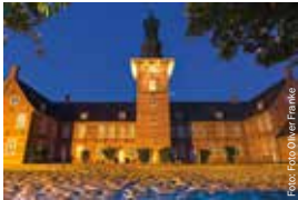
Das Schloss vor Husum erleben.

Im Frühling begrüßen Sie die Krokusblüte im Schlosspark und die Krokusblütenmajestäät. Der Sommer ist musikalisch und maritim: Erleben Sie das Schlosshof-Open Air, das Husum Open Air und die Hafentage, das größte Volksfest an der Nordseeküste Schleswig-Holsteins. Kulturfreunde kommen in der Heimatstadt des Dichters Theodor Storm rund ums Jahr auf ihre Kosten: Konzerte, Kulturnacht, (Figuren-)Theater, Film-Festivals... Im Herbst dreht sich alles um die leckeren Nordsee-Krabben, und im Winter lockt der Weihnachtsmarkt. Wenn die Nordfriesen beim Blike-Brennen das Ende der kalten Jahreszeit feiern, naht bereits die Krokusblüte.