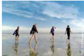
Ein Ausflug ins WeltNaturerbe Wattenmeer ist immer ein Erlebnis.

Die Insel besticht aber nicht nur durch ihre schöne Landschaft und die einmalige Ruhe im frischen Küstenwind, Pellworm lockt auch jedes Jahr mit attraktiven Veranstaltungen wie der ‚Pellwormer Osterwiese‘, den ‚Rosentagen‘, dem traditionellen Hafenfest, den Kunsthandwerkermärkten, dem Trifun und Veranstaltungen rund um das WeltNaturerbe Wattenmeer.